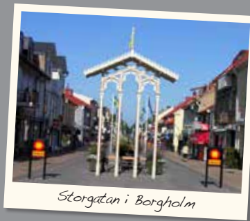
Storgatan i Borgholm

Håll dig uppdaterad på www. handlaiborgholm.nu